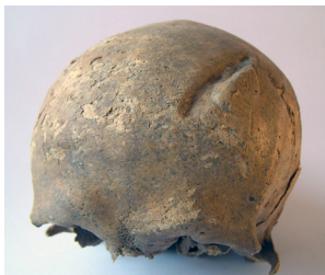
Abb. 1: Norden. Schädel mit verheilter Hiebverletzung.

Das Dominikaner- oder Prediger-Kloster in Norden, auch Bruder-Kloster genannt, soll 1264 gestiftet worden sein. Zu der Schenkung gehörten ein Grundstück am nördlichen Ende des Ortes sowie ein Haus, das vorher als Münze gedient hatte. Über die genaue Lage und die Dimensionen der Klostergebäude liegen keine Informationen vor. Bekannt sind u. a. eine Zerstörung durch Brand nach Ostern 1430 und nach der Reformation Umbaumaßnahmen für die Bedürfnisse des Grafenhauses. 1531 wurde der Komplex durch Balthasar von Esens angezündet. In den Ruinen errichtete die Grafentochter Theda den „Froichenhof“ (Fräuleinshof). 1567 wurde dort im „Osterhaus“ die neue Lateinschule (Ulrichsschule) eingerichtet, mit deren Neubau 1851/52 die letzten obertägigen Reste der Klostergebäude beseitigt worden sind. Seit dieser Zeit haben Baumaßnahmen immer wieder Backsteinfundamente und Bestattungen zutage gefördert, zuletzt im Jahre 1993, als auch eine erste Baustellenbeobachtung möglich wurde.