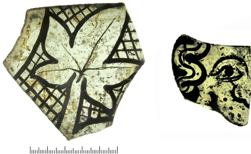
Abb. 3: Norden. Bruchstücke von bemaltem Fensterglas aus dem ehemaligen Dominkanerkloster Norden. Links: florales Motiv, rechts: Gesicht..

Wie eine dünne Holzkohleschicht auf dem Fußboden, angeschmolzene Fensterbleie, versinterte Dachschieferstücke und Rußspuren auf Keramikscherben belegen, ist der Keller von einem Brand heimgesucht worden. Der östliche Raum scheint danach wiederhergestellt worden zu sein, u. a. fand sich kleinräumig über dem verrußten Fußboden eine Sandbettung und darauf eine neue Pflasterung. Der westliche Raum ist nach dem stratigraphischen Befund mit Bau- und Brandschutt sowie Unrat verfüllt worden. Auf diese Weise ist ein reichhaltiges Fundensemble erhalten geblieben, das wegen des sonst planmäßigen Abbruchs der ostfriesischen Klöster auf anderen Plätzen bisher nicht in solcher Fülle hervorgetreten ist: Vor allem sind diverse Bleiruten und weit mehr als 3000 Scherben von gekrüseltem Fensterglas zu nennen. Etwa die Hälfte dieser Scherben trägt eine Bemalung mit Schwarzlot, wobei florale Motive überwiegen, die im Rahmen einer Grisailleverglasung wohl Rankenmuster gebildet haben (Abb. 3). Zahlreich sind auch unterschiedlich breite Stege in den Farben gelb, rot und blau. Auch Rosetten und Kreissegmente kommen vor. Selten sind figurale Darstellungen.