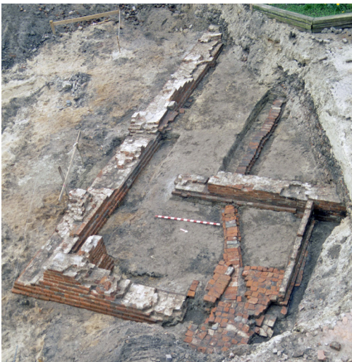
Abb. 2: Norden. Blick von Nordost auf die Fundamente eines Kellers des Dominikanerklosters. Unterhalb des ehemaligen Fußbodens verlief eine aus Backsteinen verlegte Abwasserleitung. (Foto: W. Schwarze).

worden ist, zu gehören. Dafür könnten auch einige Stücke von Buntmetallschmelz sprechen, die ebenfalls in der Grube gefunden wurden. Die Fundamentgräben des Kreuzganges müssen aufgrund von darin liegenden Keramikscherben der leistenverzierten Grauware dagegen in das 14. Jahrhundert datiert werden. Wie in vergleichbaren Fällen werden also auch im Dominikanerkloster in Norden zunächst provisorische Bauten gestanden haben, bevor die Anlage nach und nach fertiggestellt werden konnte.